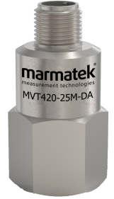
M12 cam conta

RMS Hız Çıkışı : Pin 1 : (+) Pin 2 : (-) (DA) Çıkışı : Pin 2 (-) and Pin 4 (+)